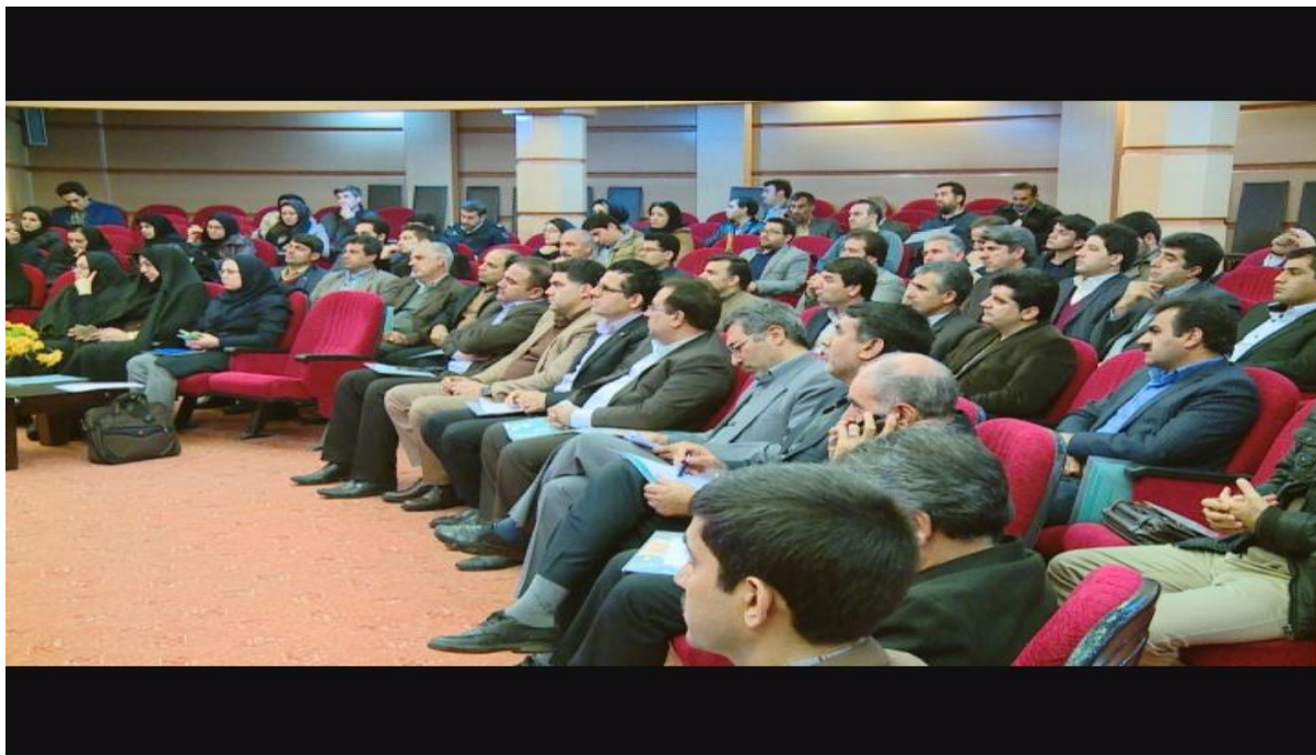
شکل ۴-۱. همایش باز آفرینی در تاریخ ۹۴/۱۰/۱۹