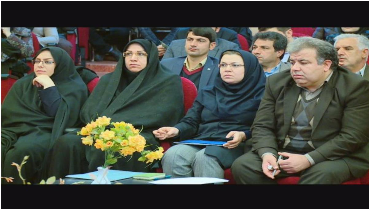
شکل ۳-۴. همایش باز آفرینی شهری ایلام در مورخ ۹۴/۱۰/۱۹