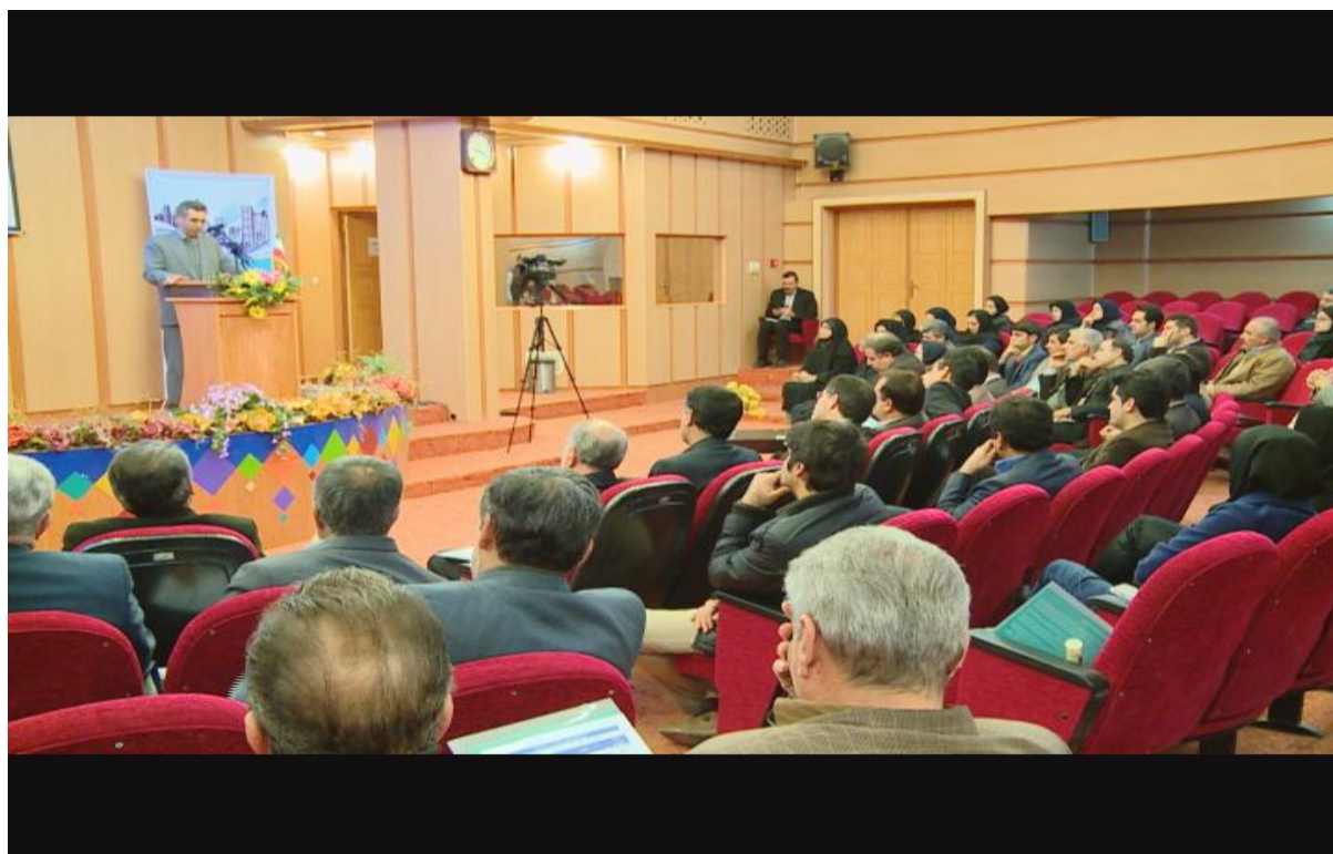
شکل ۴-۴ ، سخنرانی سیدکمال الدین میرجعفریان مدیرکل راه و شهرسازی استان ایلام