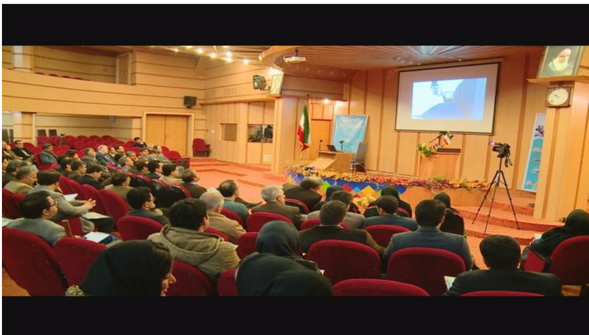
شکل ۴-۲. همایش باز آفرینی در تاریخ ۹۴/۱۰/۱۹ ارائه کلیپ