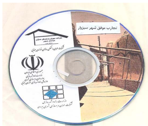
Cd پاورپوینت تجارب موفق شهر سبزوار