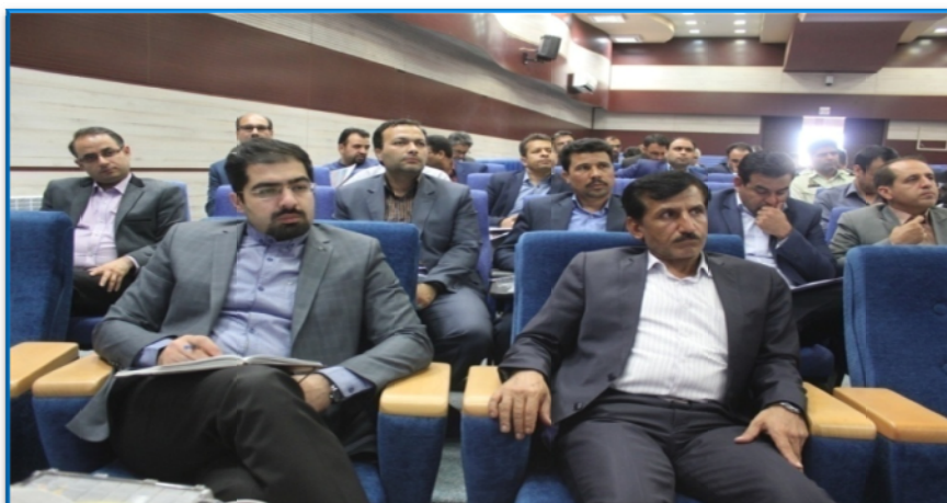
کارگاه مفاهیم پایه بازآفرینی