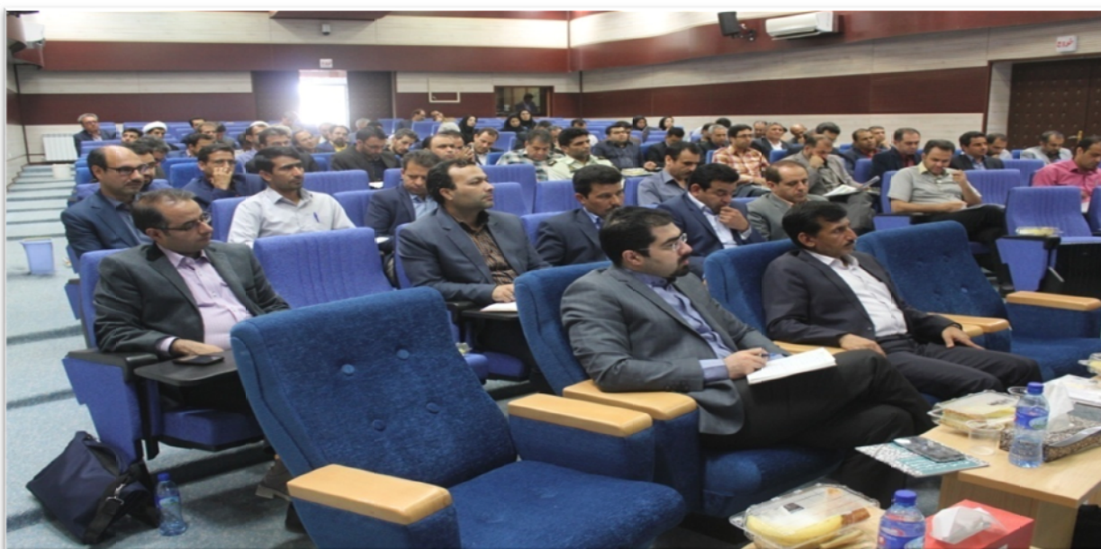
کارگاه آموزشی مفاهیم پایه بازآفرینی در محل سالن اجتماعات اداره راه و شهرسازی